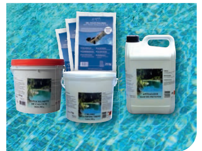
Les produits de traitement

● Conformément à la loi « Informatique et libertés » du 6 janvier 1978 modifiée en 2004, vous bénéficiez d'un droit d'accès et de rectification aux informations qui vous concernent que vous pouvez exercer à tout moment.